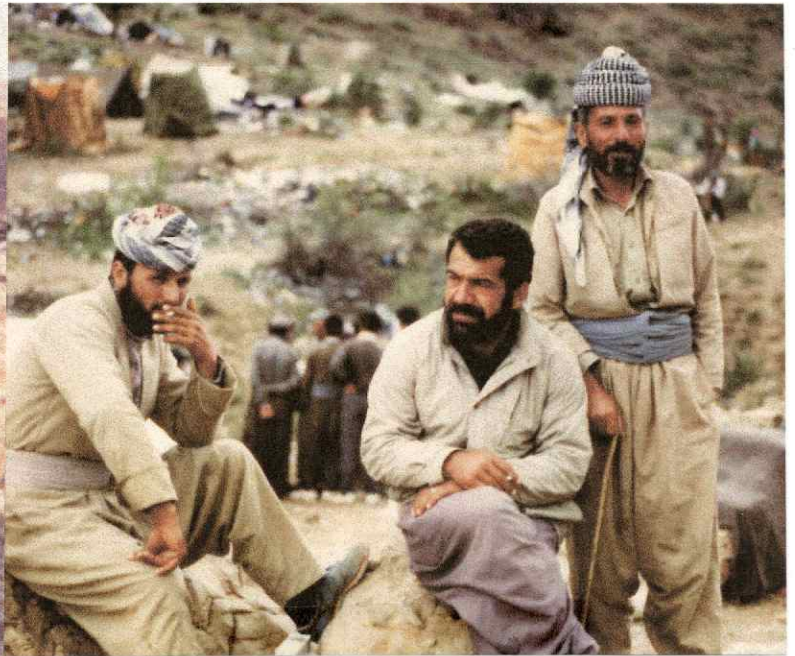
Kurdenführer im Iraq, Dahok, nahe der türkischen Grenze